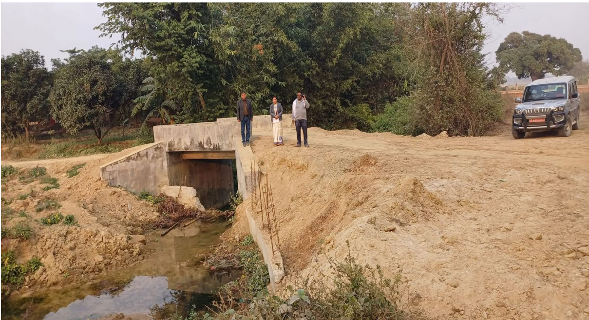
Culvert Construction Work