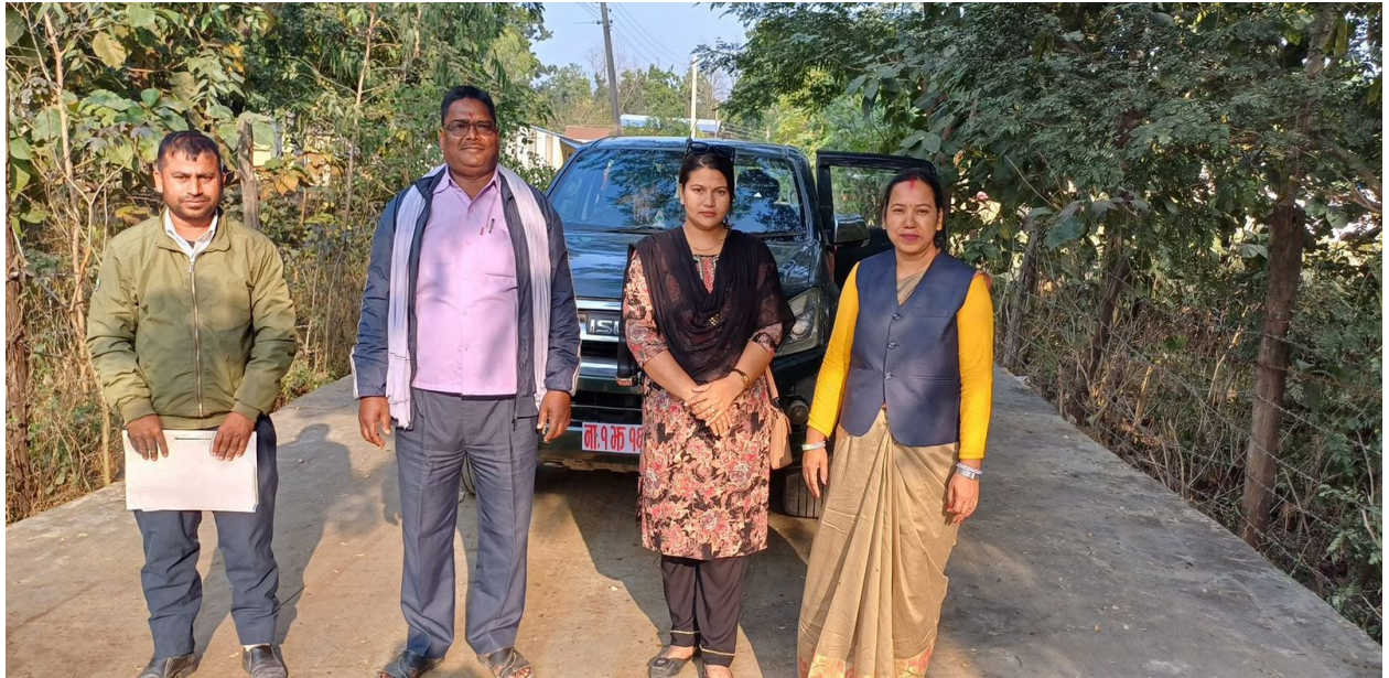
R.C.C. Road Construction Work