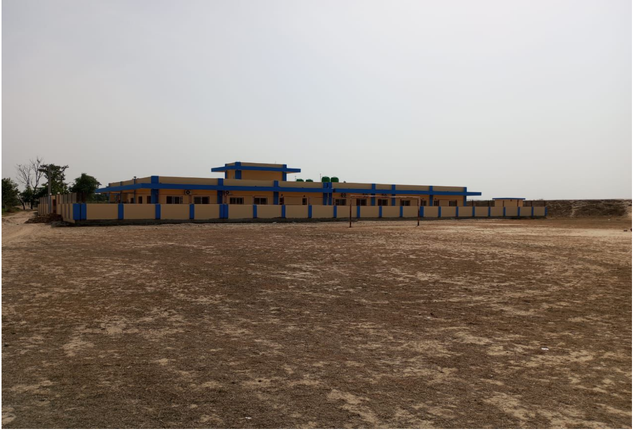
10 Bed Hospital Construction Work