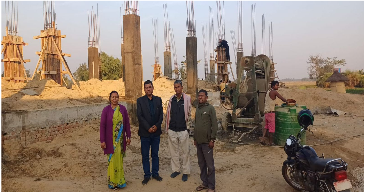
Community Building Construction Work