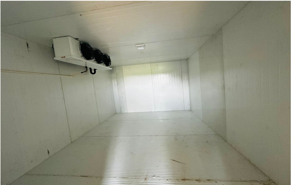
Cold Chamber Construction Work