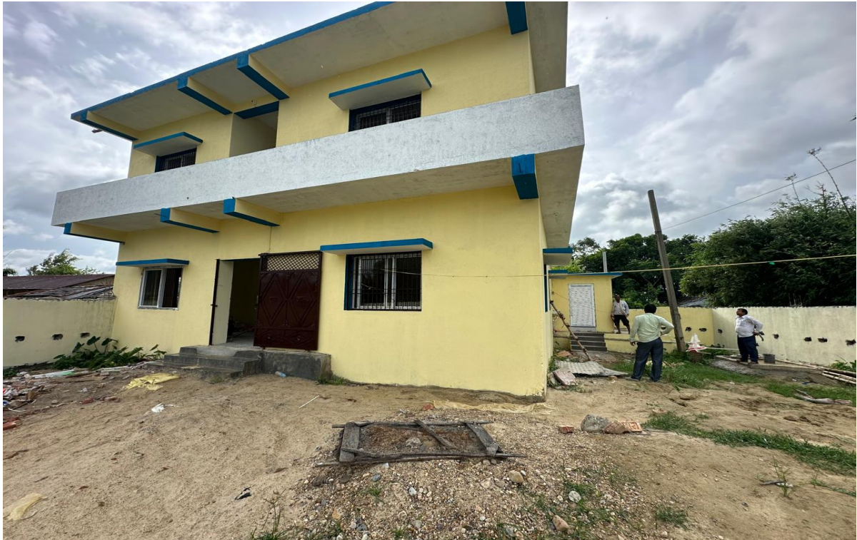
Sonbarsa Health Center Construction Work