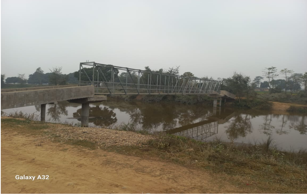
Sonbarsa Truss Bridge Construction Work