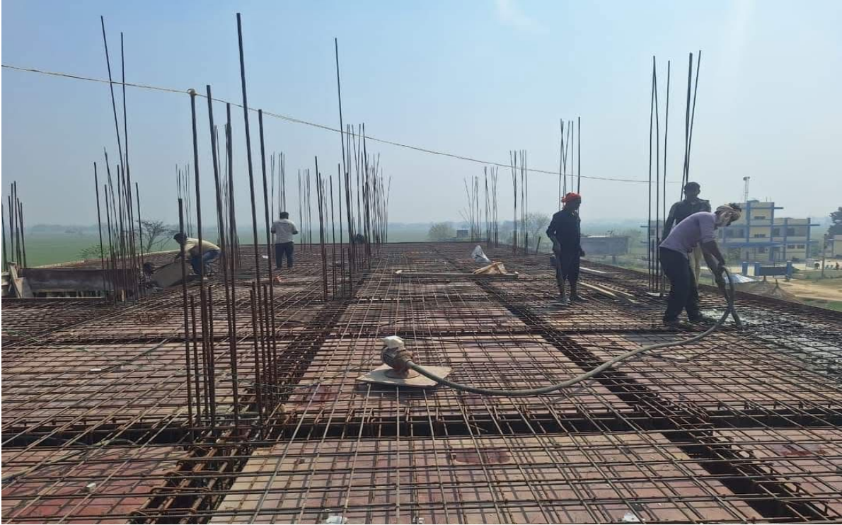
Gaupalika Bhawan Construction Work