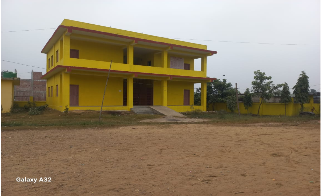
4 Room Education Building Construction Work