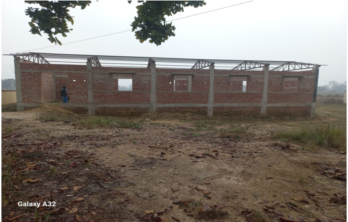
Tharu Sangrahalaya Construction