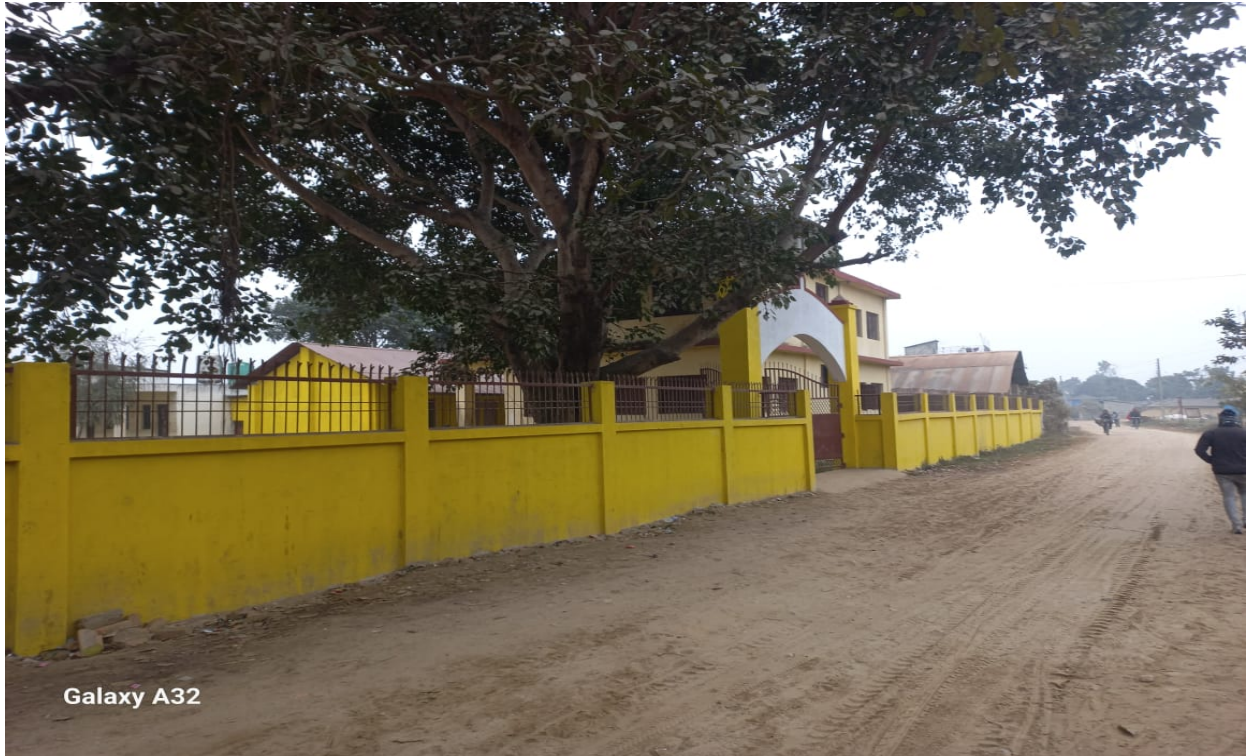
Rangpur School Compound Wall Construction Work