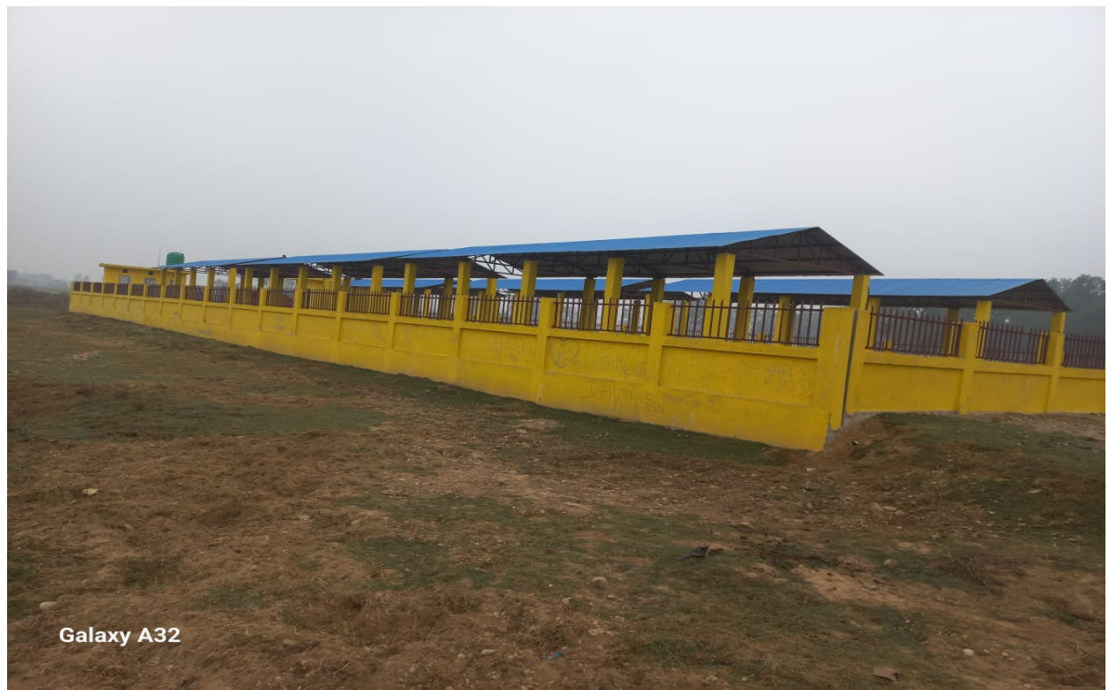
Rangpur Krishi Bazar Construction Work