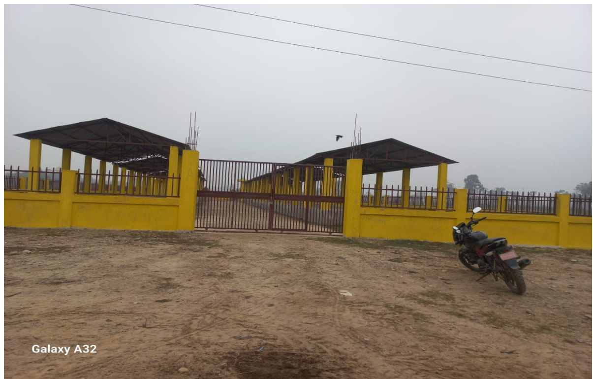
Rangpur Krishi Bazar Construction Work