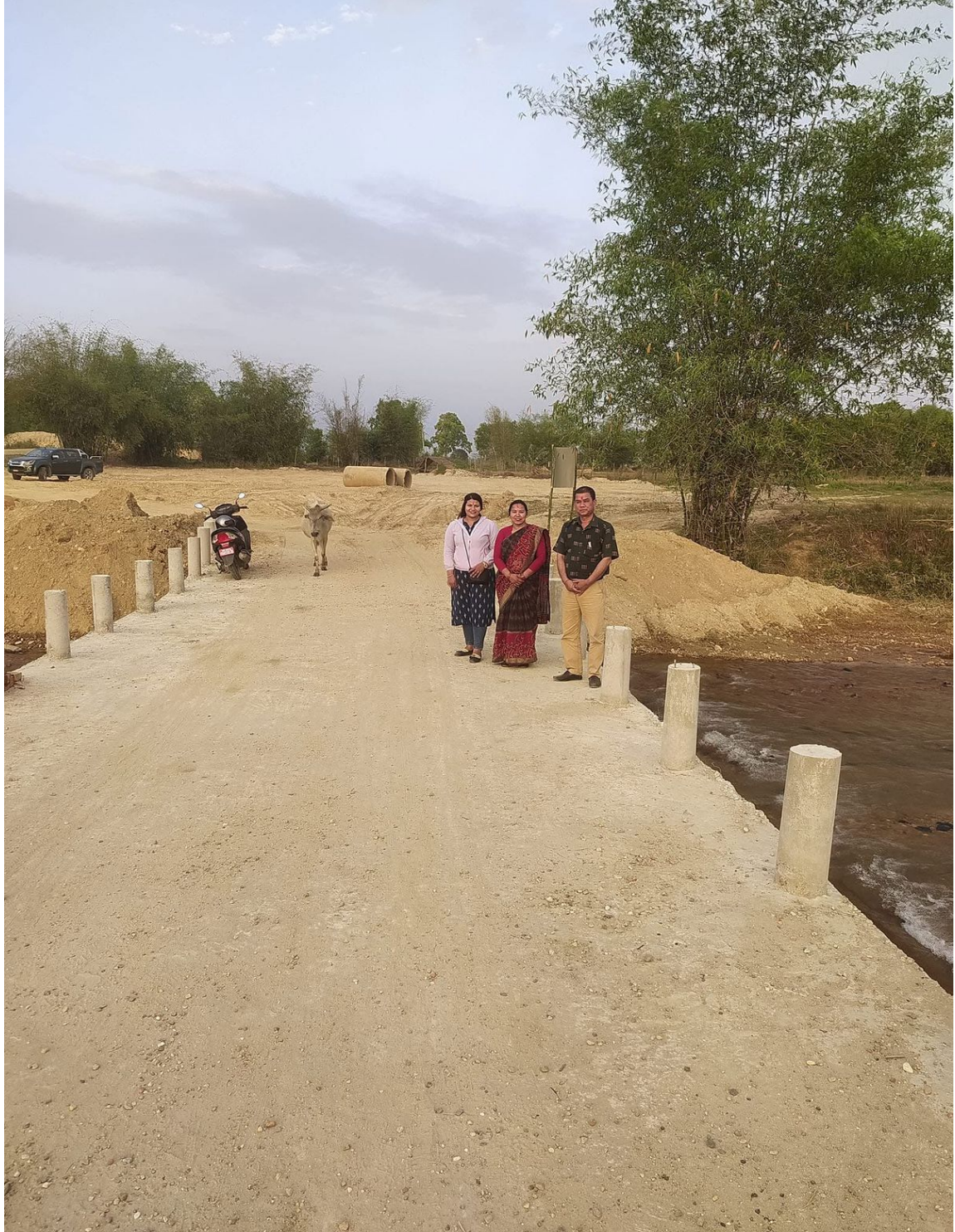
Vented Causway Construction Work