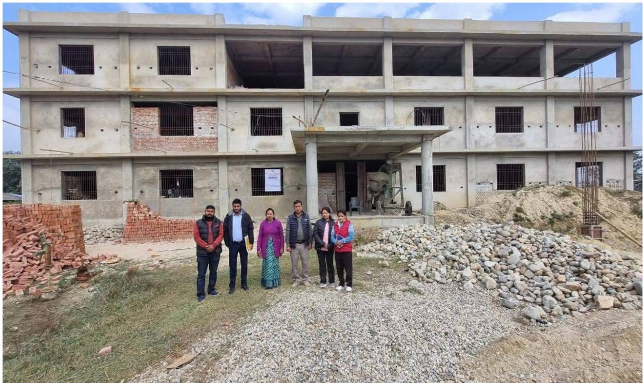
Gaupalika Office Building Construction