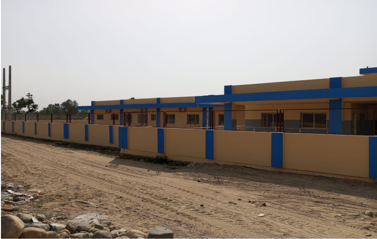
10 Bed Hospital Construction Work