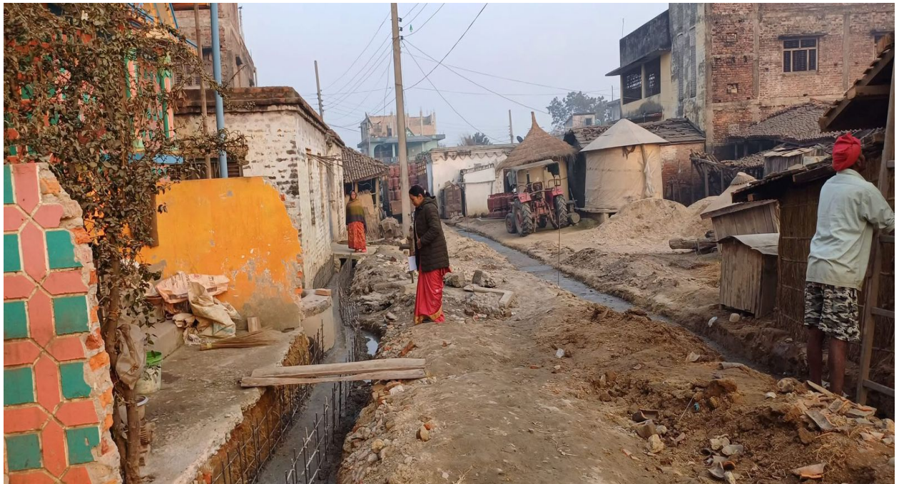
Drain Construction Work