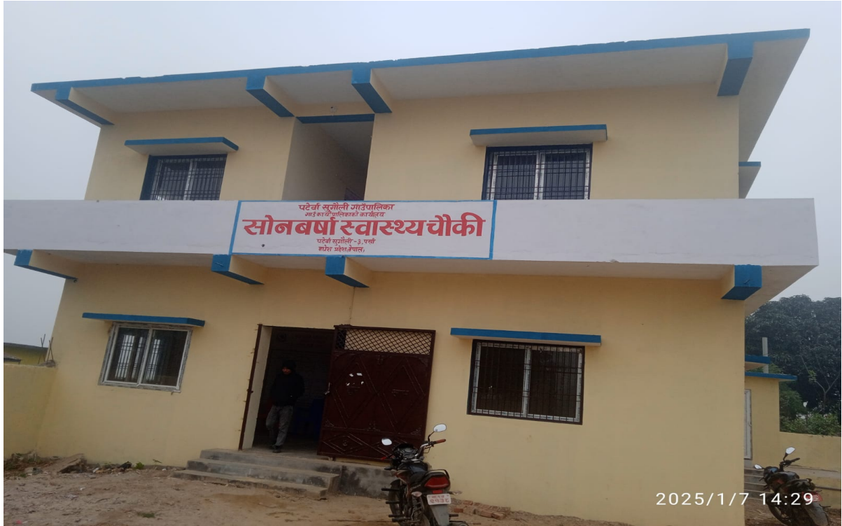
Sonbarsa Health Center Construction Work