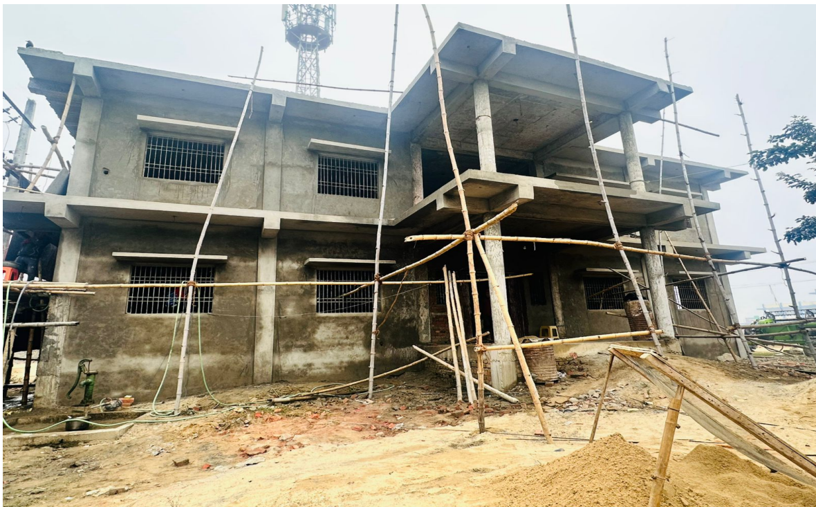
Wada No.4 Office Building Construction