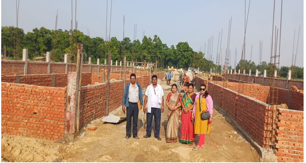
Krishi Bazar Construction Work