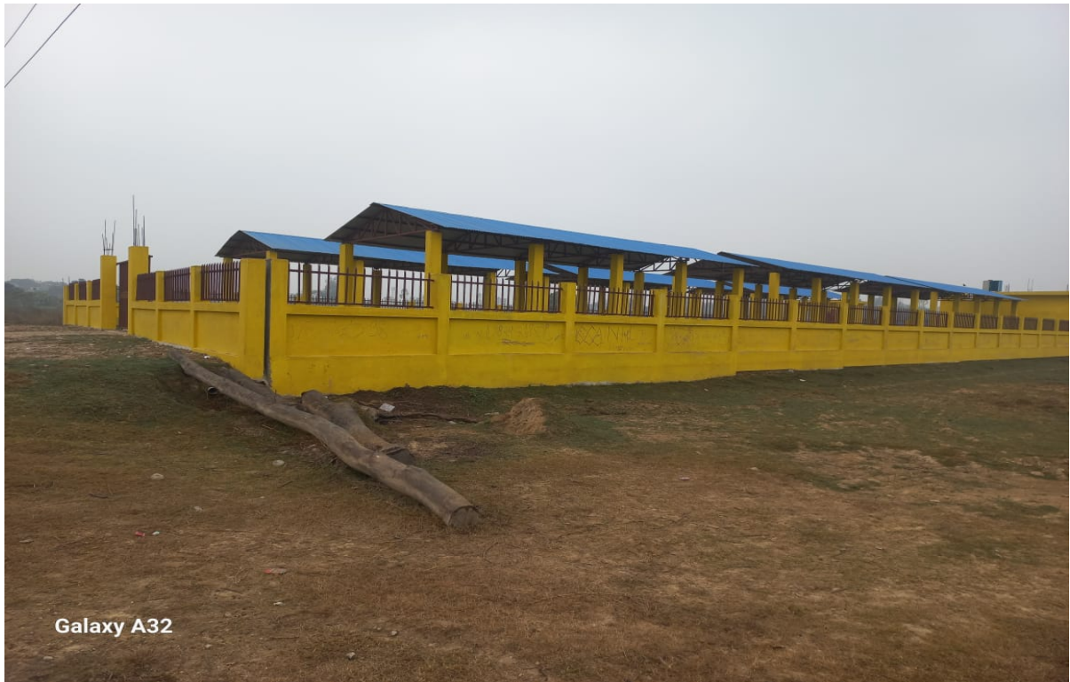
Rangpur Krishi Bazar Construction Work