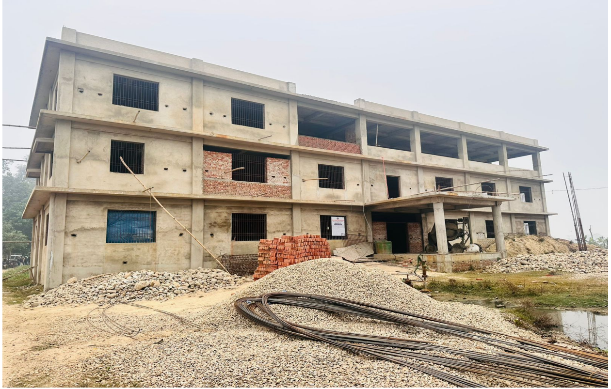
Gaupalika Office Building Construction