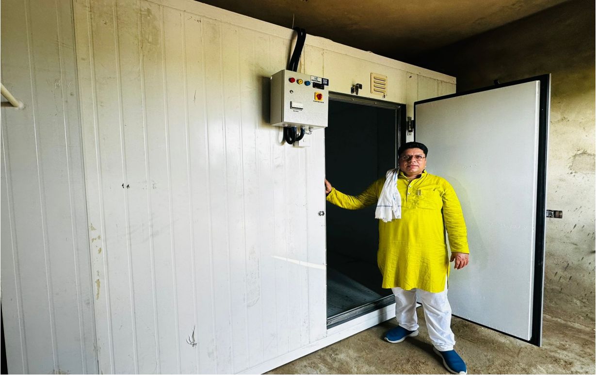
Cold Chamber Construction Work