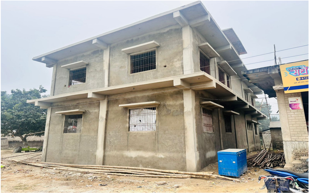
Wada No.4 Office Building Construction