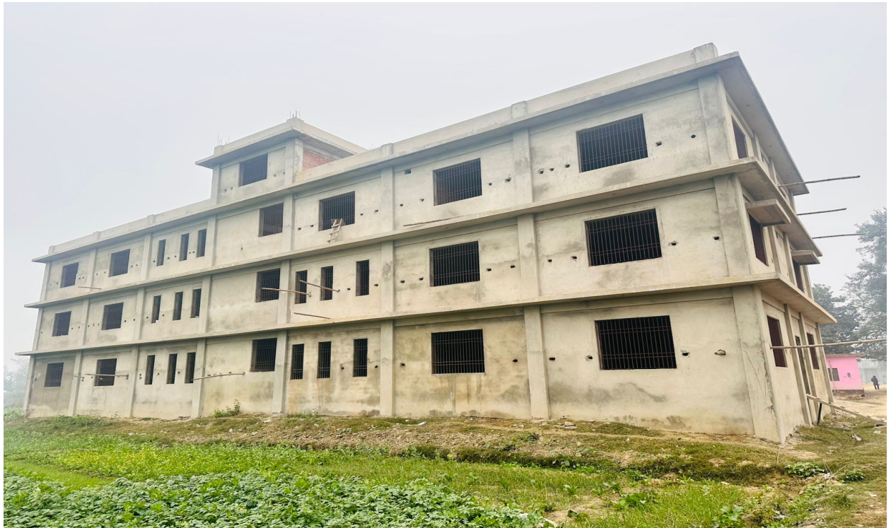
Gaupalika Office Building Construction