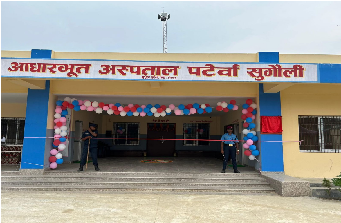
10 Bed Hospital Construction Work