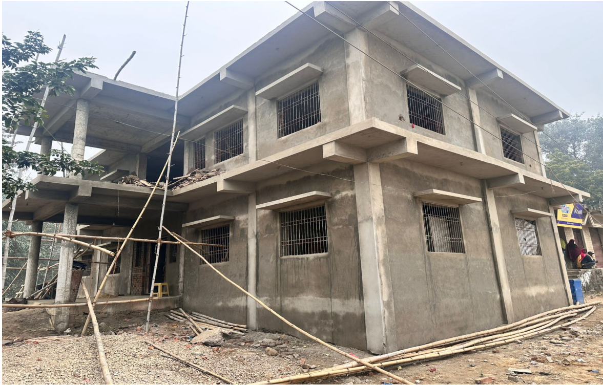
Wada No.4 Office Building Construction