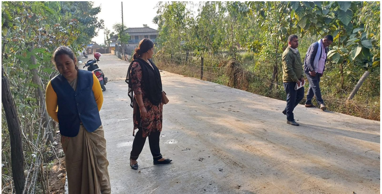
R.C.C. Road Construction Work