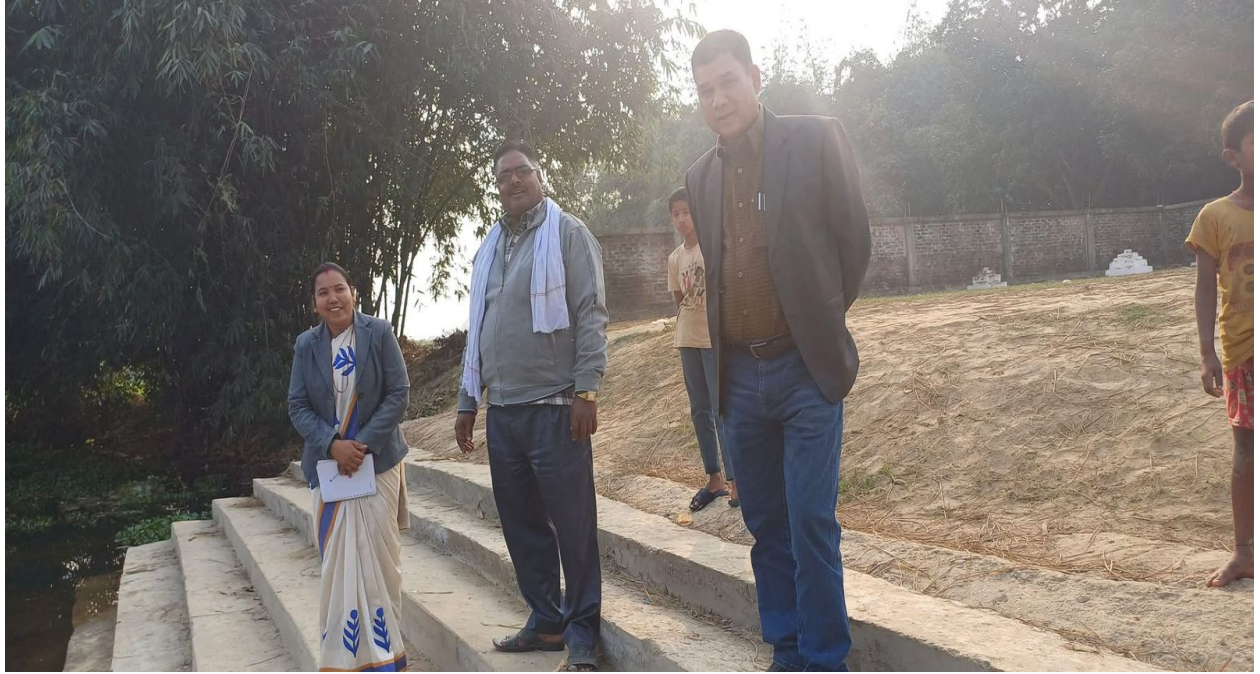
Chhat Ghat Construction Work