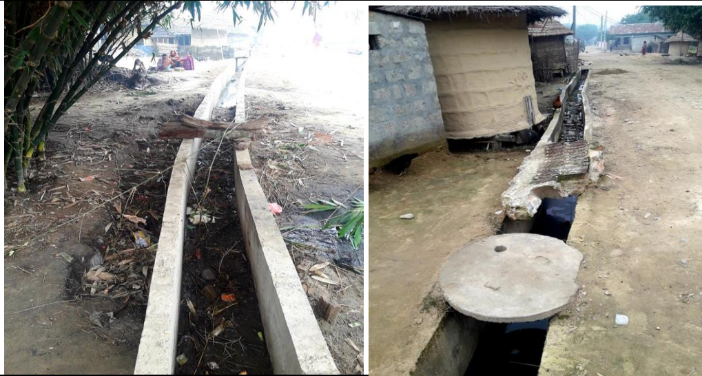
अशोक दहितको घर देखि र घर सम्मका दाँया बायाँको २ कोटेसन कार्य